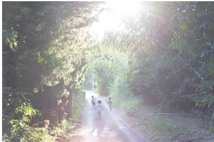
Untitled, from the series "as it is", 2020 © Rinko Kawauchi

2020年にフランスの出版社Chose CommuneとTorch Pressの共同制作により刊行された同名の写真集には、千葉の自宅を取り巻く豊かな緑の風景を背景に、娘の幼い日々を写したみずみずしいスナップが収められています。光の気配をとらえることに長けた川内は、澄みきった青空や草の葉一枚、降りたての雨粒を背に窓に張りつく小さなカエルといった、ごくありふれた光景のなかからも静かに美しさを見いだしていきます。