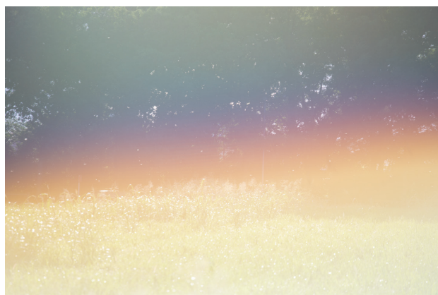
Untitled, from the series "as it is", 2020 © Rinko Kawauchi

「自分自身の懐妊、出産は最大級のインパクトでそれまで自分の歩んでいた道をスライドさせた。幼い子どもとの生活は大きな責務を負うが、その負荷を軽々と吹き飛ばす喜びと発見があり、それまで生きることにに対して積極的ではなかった自分を、生のほうへ向かわせた。