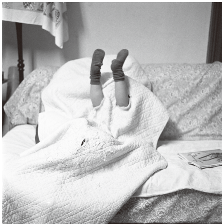
Tokuko Ushioda From the series My Husband

日本の写真表現を切り拓いてきた2人の写真家 ここに出会い、「家」「家族」「日々の営み」をめぐる それぞれの思索が響き合う。