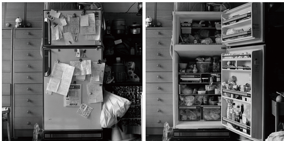
Setagaya, Tokyo, 1983 From the series ICE BOX